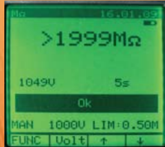
Isolationsmessung mit 1000 V DC