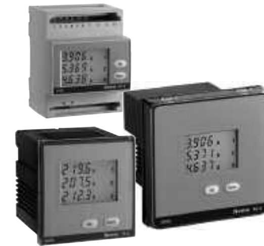
Cod. MF6G.. • MF7G.. • MF9G..

Die Anzeigeseiten und die Größen weichen abhängig von der Anschlussart (einphasig, dreiphasig 3 und 4 Leitungen) ab. PRÜFUNG DER PHASENFOLGE Beim Einschaltung des Gerätes wird geprüft, ob die Voltmeterphasen (Phasenfolge) richtig angeschlossen sind. Ob der Anschluss falsch ist, wird Err 123 YES angezeigt. In diesem Fall müssen Sie den Voltmeterphasenanschluss verbessern und die Prüfung wiederholen, bis Sie die richtige Folge erreichen. ACHTUNG! Eine falsche Phasenfolge kann Messfehler verursachen.