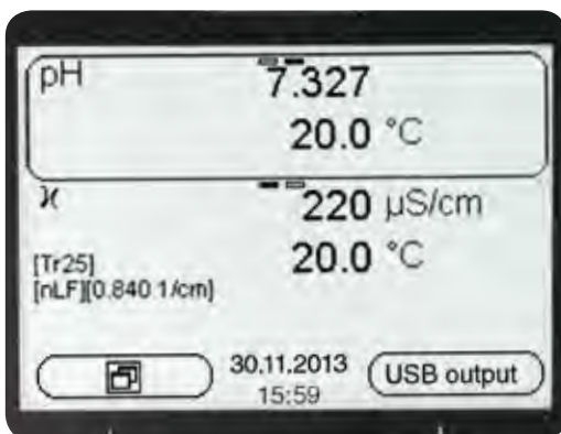
Display mit Messwertdarstellung

Das Multi 3320 für die Messung von pH, ISE, Redox, Leitfähigkeit und gelöstem Sauerstoff (elektrochemisch) ist ein ideales Gerät für Umweltsanwendungen im Bereich der Grund- und Oberflächenwassermessung, in der Aquakultur sowie in der Kläranlage und vielem mehr. Auch gelegentliche einfache ISE-Messungen deckt dieses Gerät ab.