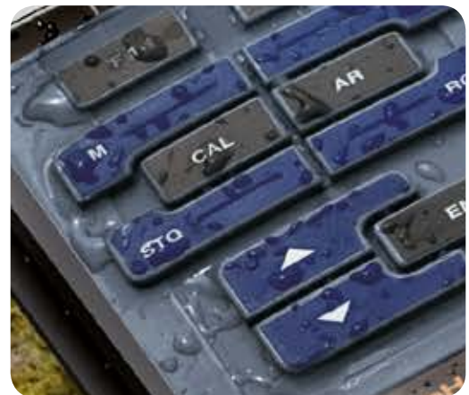
Robuste Silikontastatur mit geschlossener Oberfläche - 100% wasserdicht