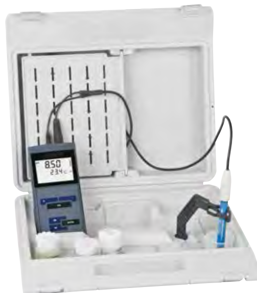
Set im Tragekoffer

Das Kofferset dient auch als kleines Feldlabor.