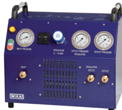
Portables SF 6 -Transfergerät, Typ GTU-10