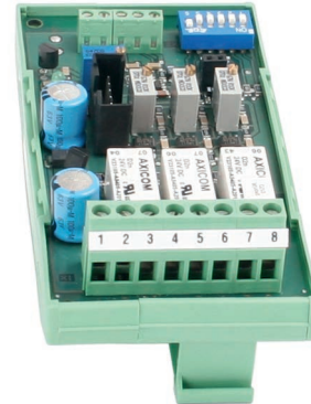
Analoger Grenzwertschalter, Typ EGS01