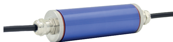
Analoger Kabelmessverstärker, Typ B1940