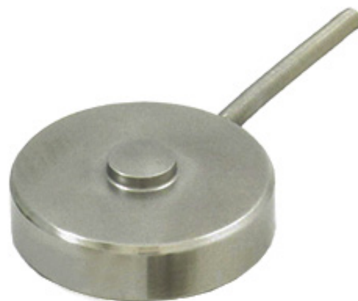
Druckkraftaufnehmer, Typ F1226