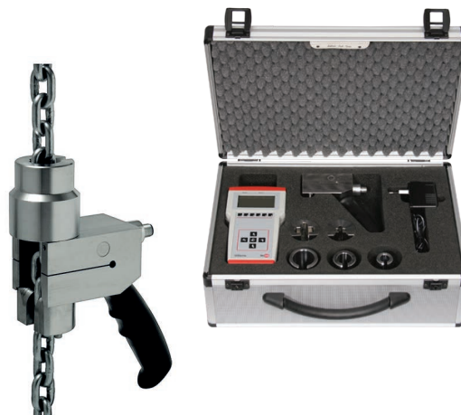
Kettzugprüfset, Typ FRKPS