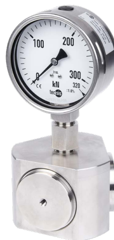
Hydraulischer Druckkraftaufnehmer, Typ F1122

Die Kraftmessung erfolgt nach dem hydraulischen Prinzip: Die auf einen Kolben wirkende Kraft führt zu einem Druckanstieg, den ein angeschlossenes Anzeigegerät visualisiert. Dabei kann die Skale des Anzeigegerätes in verschiedenen Einheiten ausgelegt werden, z. B. N, kN, kg, t.