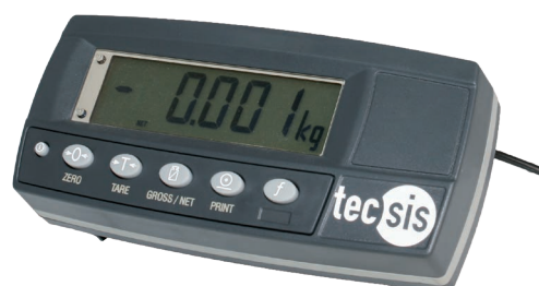
DMS-Wägeelektronik, Typ E1932

Eine ultraflache, digitale Wägeelektronik mit Frontpanel aus CrNi-Stahl, ist ebenfalls erhältlich. Dieser Typ kann auch mit IP65-Gehäuse aus CrNi-Stahl, für die Wand-/Tischmontage geliefert werden.