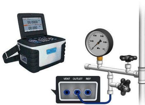
Kalibrierung von Manometer