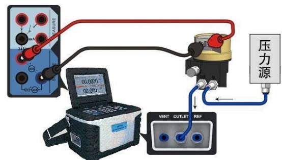
Kalibrierung von I/P Konverter

Durch die DAkkS nach DIN EN ISO/IEC 17025:2005 akkreditiertes Laboratorium. Die Akkreditierung gilt nur für den in der Urkundenanlage D-K-15055-01-00 aufgeführten Akkreditierungsumfang.