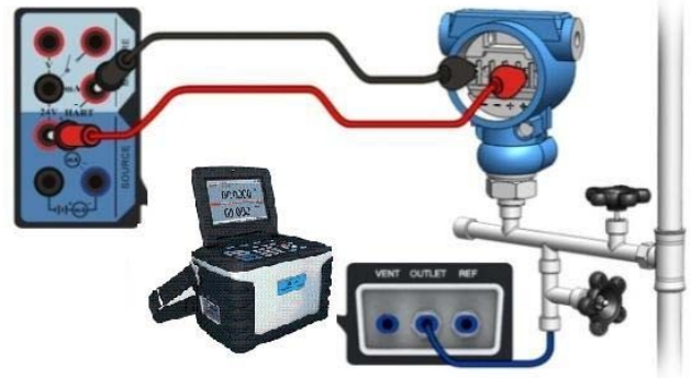
Kalibrierung von HART Transmitter