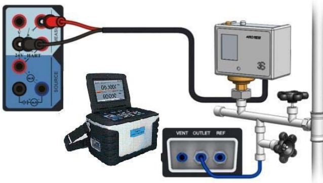
Kalibrierung von Druckschalter