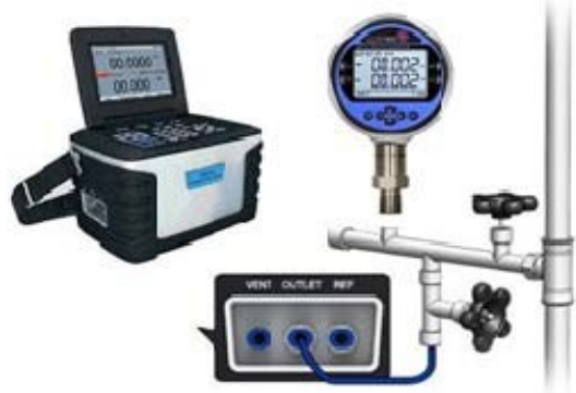
Kalibrierung von Digitalmanometer