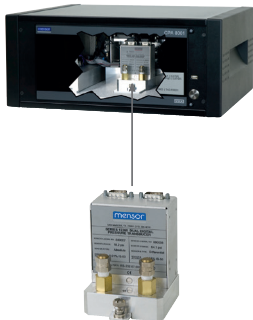
Modularer Aufbau der Hardware (Sensor CPR8001)

Ein modularer Aufbau vereinfacht die Wartung. Das Elektronikmodul und der Regler sind eigenständige Baugruppen, die keine Wartung benötigen. Sollte dennoch eine Wartung nötig sein, kann jede Komponente entfernt und einfach durch ein neue Baugruppe ersetzt werden.