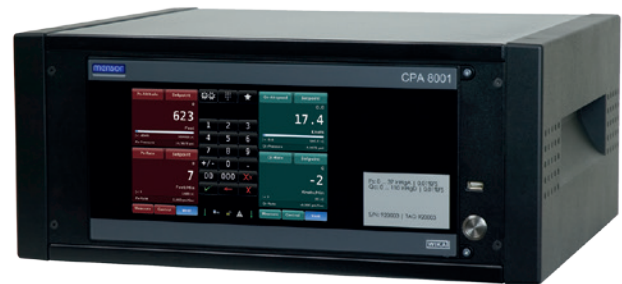
Druckcontroller Air Data Test Set, Typ CPA8001