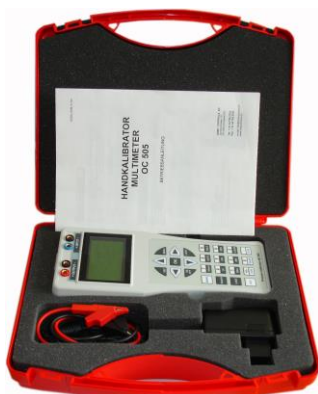
IOC505 im Koffer mit Zubehör

Schnelle Signalvorgänge am Messeingang können gespeichert werden. Dafür stehen acht individuelle Speicherplätze TRANSIENT NO.1 ... TRANSIENT NO.8 zur Verfügung. Die Messung erfolgt mit Speicherrate von 1ms. Jede Transiente beinhaltet 256 Punkte und kann zeitlich von 0.25 bis 300 Sek. bestimmt werden. Der Triggerpegel ist wählbar. Ein SoftManager unterstützt Download der Transienten in einen Windows PC.