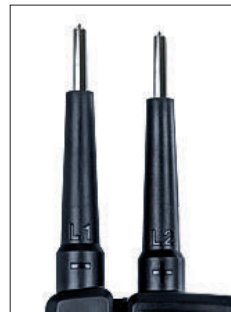
Mit aufgeschraubten Metallhülsen 4 mm