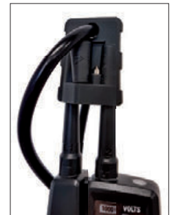
Schutzkappe mit Aufnahmefach für Metallhülsen