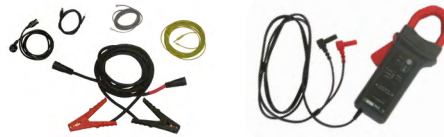
Prüfkabel und Stromzange

Bereiche: 40 A DC (10 mV/A) und 400 A DC (1 mV/A) Genauigkeit: 1,5 % bis 40 A; 2 % bis 400 A. Max. Leiterdurchmesser: 30 mm.