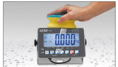
Edelstahl Auswertegerät mit Schutzgrad IP68, hygienisch und leicht zu reinigen. Tischfuß inklusive Wandhalterung für das Auswertegerät serienmäßig, Details siehe KERN KXS-TM