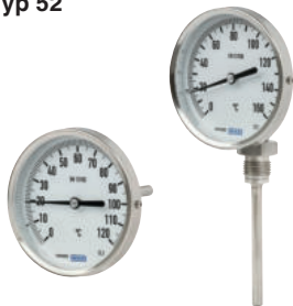
Typ A52.100 Typ R52.100