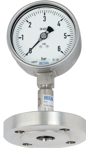
Druckmittlersystem, Typ DSS26M