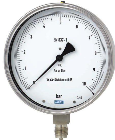
Feinmessmanometer, CrNi-Stahl, Typ 332.50