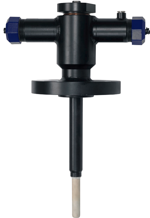
Saphirsensor mit Keramik-Außenschutzrohr, Typ TC84