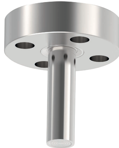
Druckmittler für Flanschanschluss, Typ 990.49