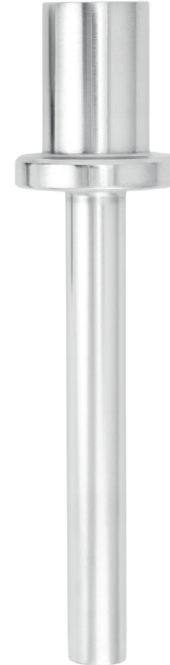
Einteiliges Schutzrohr für lose Flansche, Typ TW30