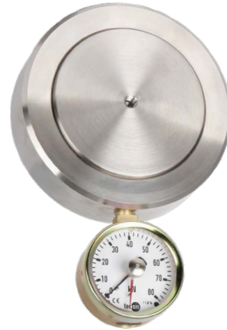
Hydraulischer Druckkraftaufnehmer, Typ F1135

Hydraulische Kraftaufnehmer arbeiten nach dem Prinzip, dass die auf den Kolben wirkende Kraft – entsprechend der Kolbenfläche – in einen hydraulischen Druck umgewandelt wird. Über das angeschlossene Messgerät, das analog oder digital gewählt werden kann, wird der Messwert ausgegeben. Dabei kann die Skala des angeschlossenen Manometers in verschiedenen Einheiten ausgelegt werden, z. B. in N, kN, kg oder auch t.