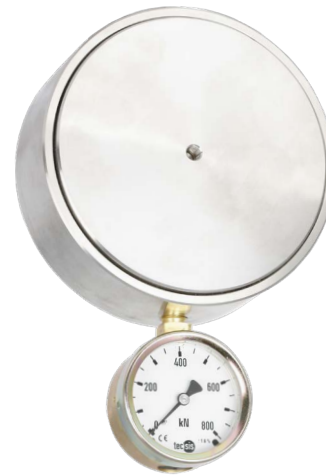
Hydraulischer Druckkraftaufnehmer, Typ F1145

Hydraulische Kraftaufnehmer arbeiten nach dem Prinzip, dass die auf den Kolben wirkende Kraft – entsprechend der Kolbenfläche – in einen hydraulischen Druck umgewandelt wird. Über das angeschlossene Messgerät, das analog oder digital gewählt werden kann, wird der Messwert ausgegeben. Dabei kann die Skala des angeschlossenen Manometers in verschiedenen Einheiten ausgelegt werden, z. B. in N, kN, kg oder auch t.