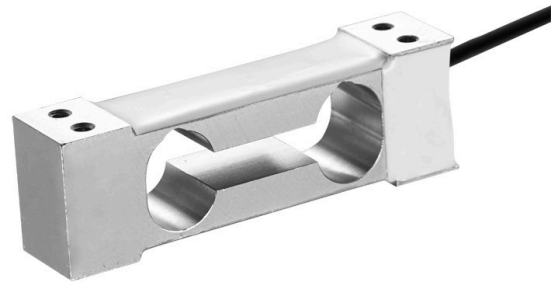
Plattformwägezelle, Typ F4802