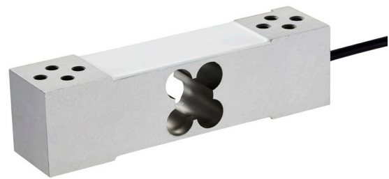
Plattformwägezelle, Typ F4818