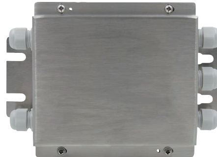
Anschlusskasten, Typ B6578