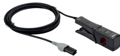
ZANGENSTROMWANDLER MINI 94

Der Zangenstromwandler Mini94 ermöglicht die Messung von Wechselstrom von 50 mA bis 200 A ohne Eingriff in die Anlagen (keine Unterbrechung des zu messenden Stroms). Aufgrund seiner hervorragenden Genauigkeit (Verstärkung und Phasenverschiebung/Genauigkeitsklasse 0,2) eignet er sich besonders für Strommessungen mit Leistungs- und Energieanalysatoren. Er kann unter anderem zur Überprüfung von Energiezählern herangezogen werden.