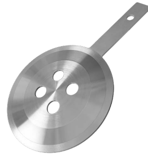
Mehrloch-Steckblende, Typ FLC-MP

Mehrloch-Steckblenden vom Typ FLC-MP erhöhen durch ihre Richtwirkung auf die Strömung und den einfachen Einbau die Wirtschaftlichkeit und Flexibilität hinsichtlich der Einsatzbereiche.